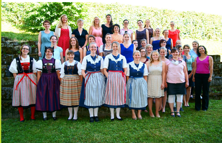
Die Klasse Fachausbildung Bäuerin Vollzeit 2015

60 Frauen der Klassen „Fachausbildung Bäuerin berufsbegleitend 2013 – 2015“ und „Fachausbildung Bäuerin Vollzeit 2015“ feierten am 10. Juli 2015 mit ihren Angehörigen und Gästen den Abschluss am Strickhof. So viele waren es noch nie. Die Feier setzte den Schlusspunkt hinter ein intensives halbes Jahr, indem nicht weniger als 36 Frauen die Vollzeit Fachausbildung mit viel Herzblut absolvierten. Dieses für alle neue Experiment „36er Klasse“ war rundum erfolgreich und verdient ein grosses Dankeschön an alle Beteiligten. Falls die Nachfrage weiter so hoch bleibt, werden wir im 2017 wieder eine Grossklasse führen. „Unseren“ Absolventinnen wünschen wir, dass sie die neuen Werkzeuge, die sie durch die Fachausbildung mitbekommen haben, mit Freude, vielseitig und selbst bewusst einsetzen können. Wir freuen uns, euch irgendwo wieder zu sehen, vielleicht am Strickhof!